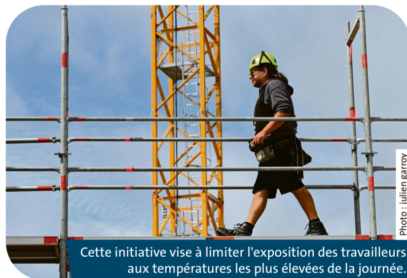
Cette initiative vise à limiter l'exposition des travailleurs aux températures les plus élevées de la journée.